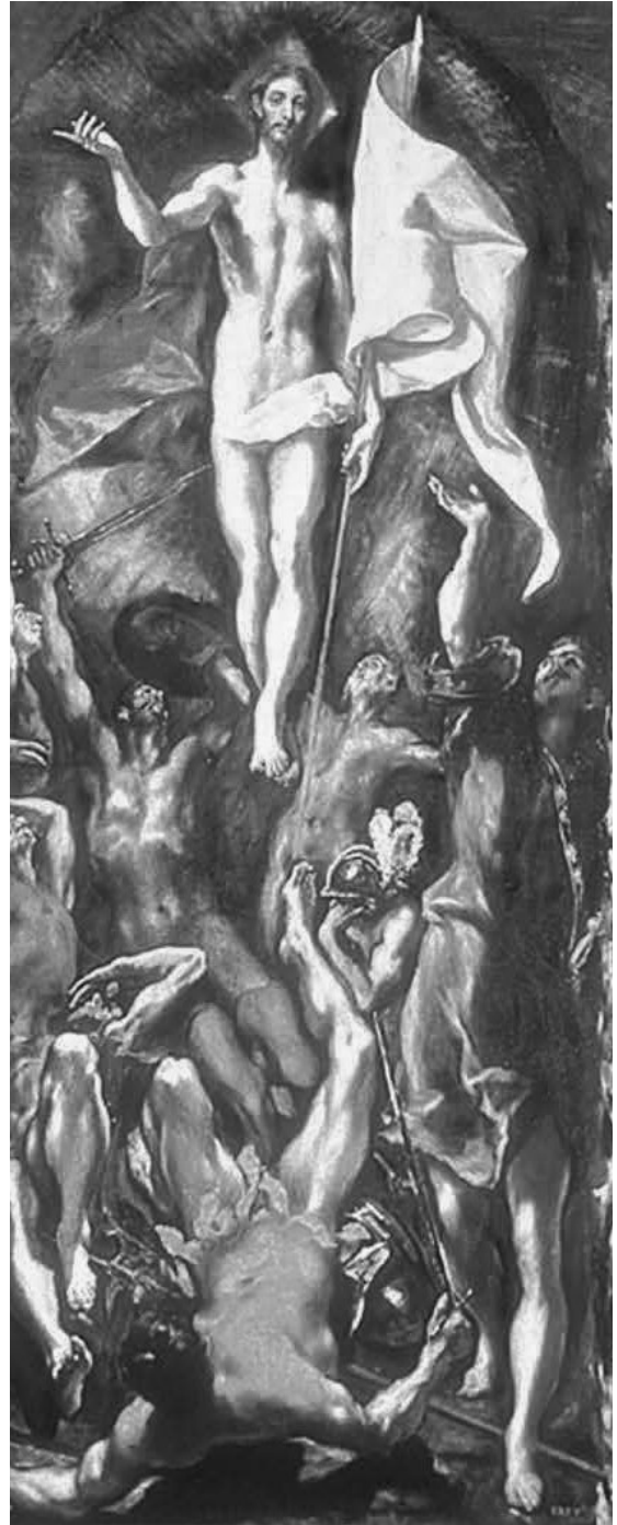
Δομήνικος Θεοτοκόπουλος, Ανάσταση, από το βιβλίο της Μ. Λαμπράκη-Πλάκα El Greco, ο Έλληνας , εκδ. Καστανιώτη

Γαλάτεια Γρηγοριάδου-Σουρέλη, Ο αγέρας παίζει φλογέρα, εκδ. Πατάκη